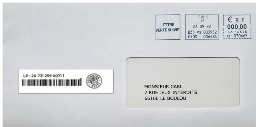
Lettre verte suivie